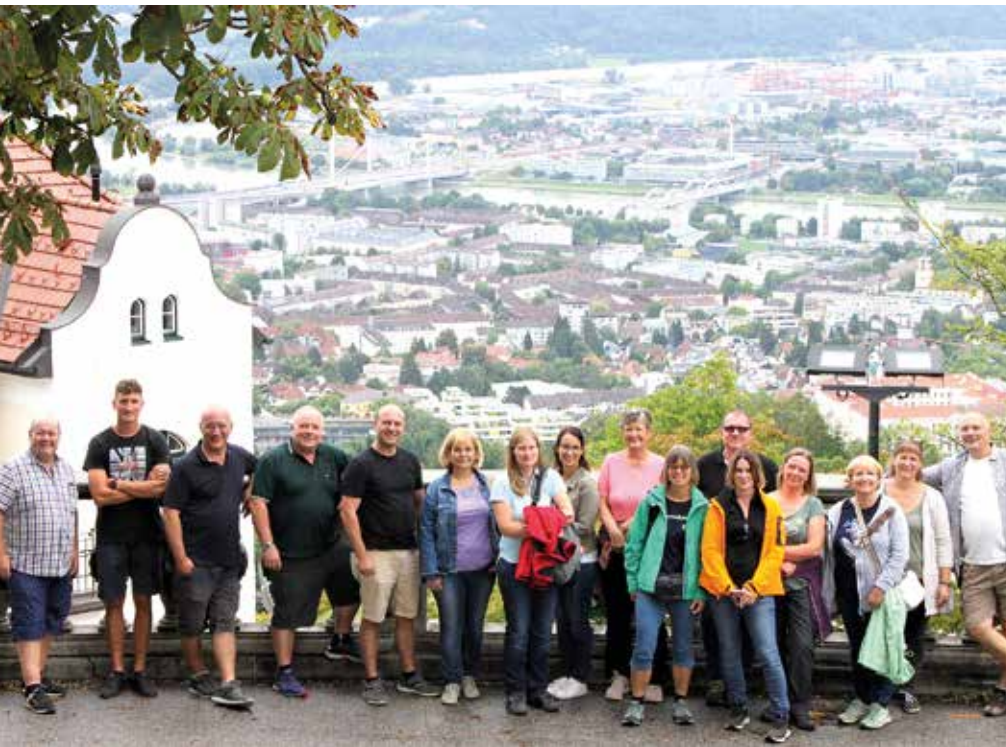
Teambuilding unserer Gemeindebediensteten bei einem gemeinsamen Ausflug in die Region Linz/Steyr.