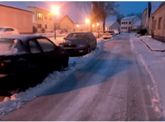
Slalomfahren beim Winterdienst - der Albtraum jedes Einsatzfahrers – Schäden vorprogrammiert

Am Ende der Winterdienstsaison, die mit einigen wenigen Einsätzen wieder verhältnismäßig ruhig verlaufen ist, möchten wir uns trotzdem für die Unannehmlichkeiten entschuldigen, die nach einem irreparablen Schaden an unserem Winterdienstfahrzeug in einigen Straßenzügen in Wolfpassing und