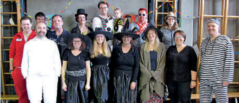
Das Organisationsteam des Kulturvereines „Ars Cultura“

Zaubertricks Jung und Alt. Erfreuliches Schätzspiel-Ergebnis: Der Gewinner des Geschenkkorbes ließ diesen versteigern, der erzielte Betrag von € 105,- wird dem St. Anna Kinderspital gespendet.