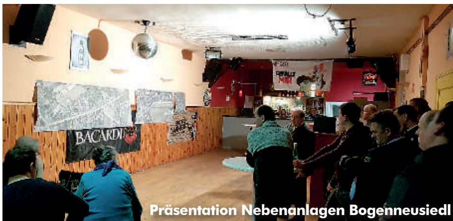
Präsentation Nebenanlagen Bogenneusiedl

für die nächste reguläre Ausgabe der Gemeindezeitung ist der 11. Juni 2019 .