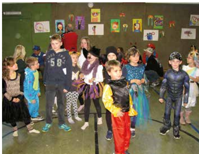
Die Kinder ...

len Schätzspiel seine Berechnungen kund tun. Ein gelungener Faschingsnachmittag für Jung und Alt!