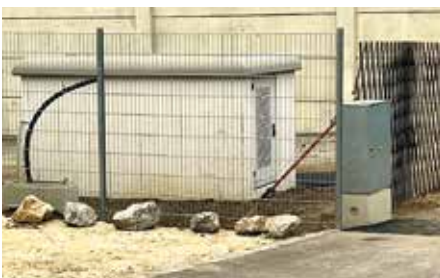
Der neue leistungsstarke Trafo.

In wenigen Wochen werden die Glascontainer aus dem Bereich der Lagerhaustankstelle und der HUMANA-Container vis-à-vis vom Gasthaus ebenso in den Vorbereich des Bauhofes verlegt. Die Art der Platzbefestigung wird derzeit überlegt und zügig umgesetzt, wir bitten um Kenntnisnahme dieser Standortverlegung.