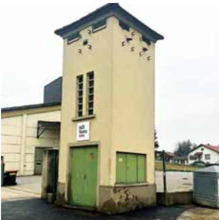
Der alte Trafo hat ausgedient.

Die Errichtung unserer 132 kWp PV-Anlage auf den Dächern von Bauhof und Wertstoffsammelzentrum ist abgeschlossen, der Verein „Erneuerbare Energiegemeinschaft EEG Hochleithen 1“ ist gegründet, nach der Entsendung der Gemeindevertreter nach der Gemeinderatswahl kann eine Konstituierung des Vereins tatsächlich vorgenommen werden, in einem weiteren Schritt ist geplant, neben der Versorgung von Gemeindeobjekten, FF Haus und Musikheim auch überzählig produzierten Strom an unsere Verbandskläranlage weiterzugeben. Die Erneuerung des aufnehmenden leistungsstärkeren Trafos samt Versetzung war notwendig, der Alttrafo ist auch schon abgebrochen. Mit der Inbetriebnahme am 30.01.2025 liefern wir grünen Strom ins Netz.