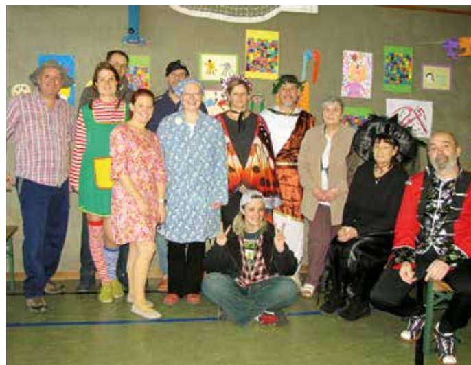
... und das Veranstalterteam