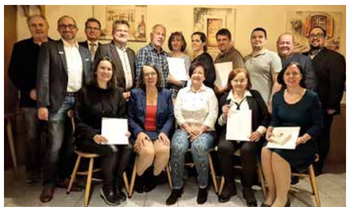
ÖRK Bronzenes Verdienstzeichen